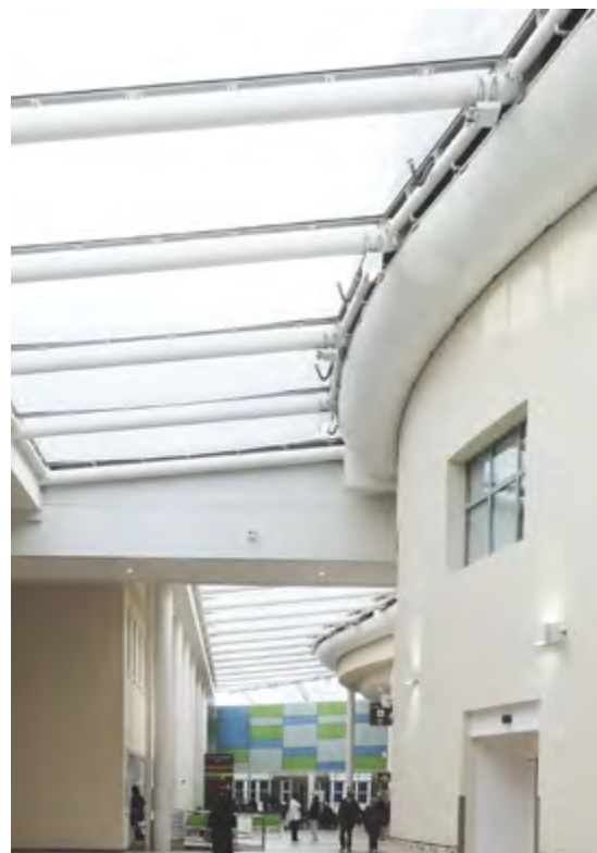
Verdens første Cradle to Cradle-sertifiserte ventilasjonskanal. Broomfield Hospital, Chelmsford, UK