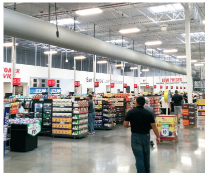
WinCo Foods, San Marcos