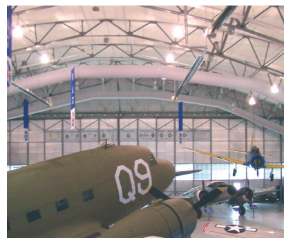
Dover Air Base