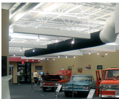
The National Corvette Museum