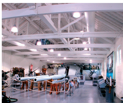
Priddy's Hard Museum