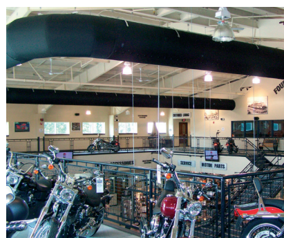
Four Rivers Harley Davidson