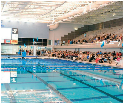
Greensboro Aquatic Centre