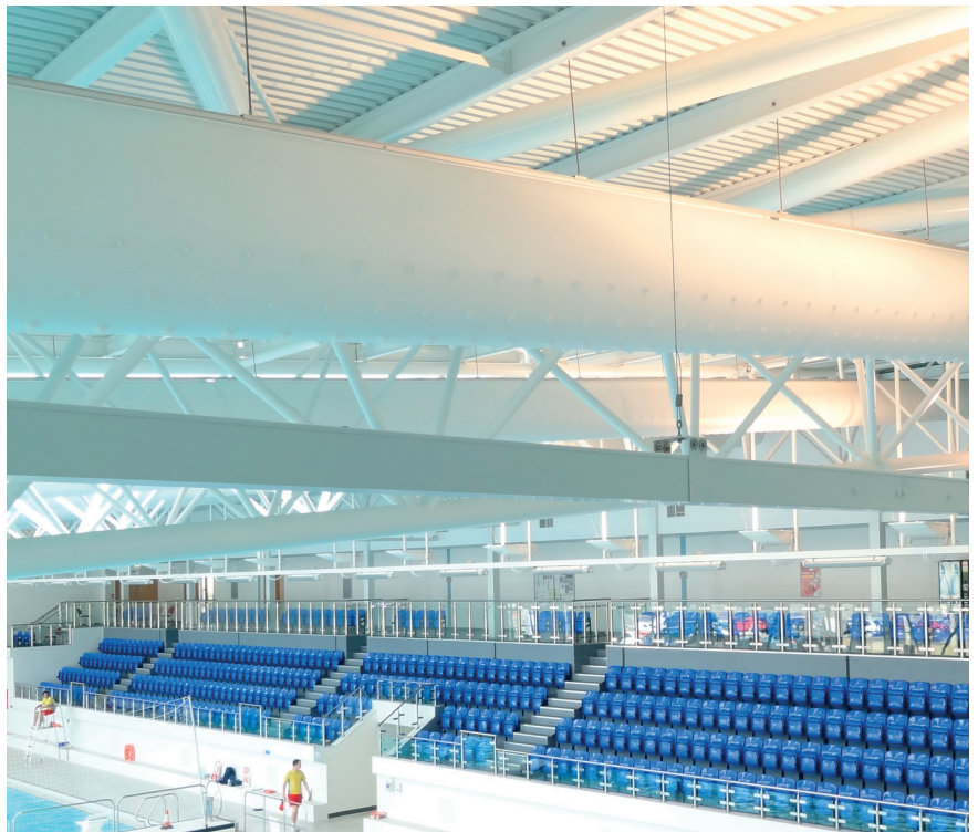
Basildon, OL 2012