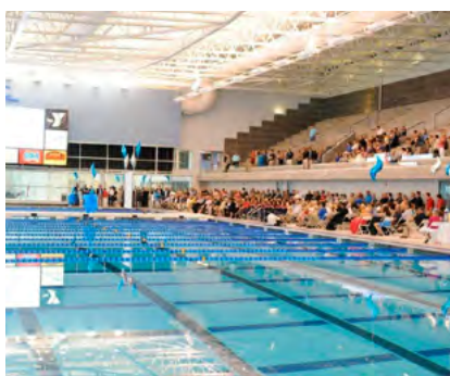
Greensboro Aquatic Centre