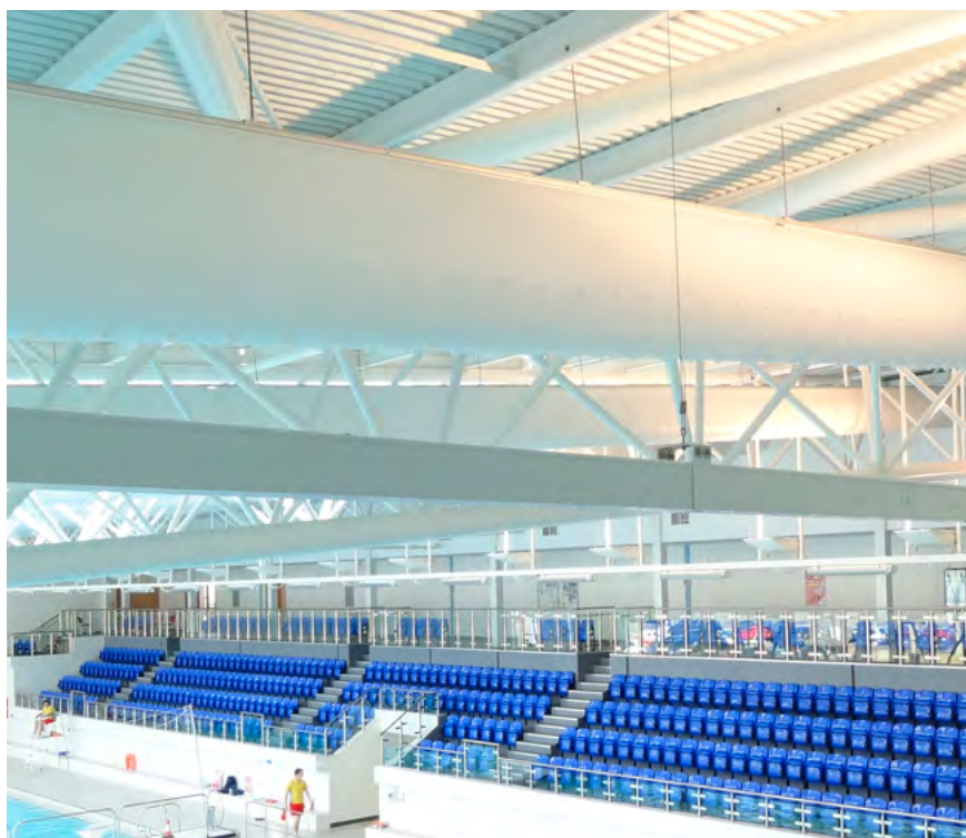
Basildon, OL 2012