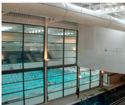
Fulham Swimming pool

We bieden een groot aantal goed gedocumenteerde referentie projecten: