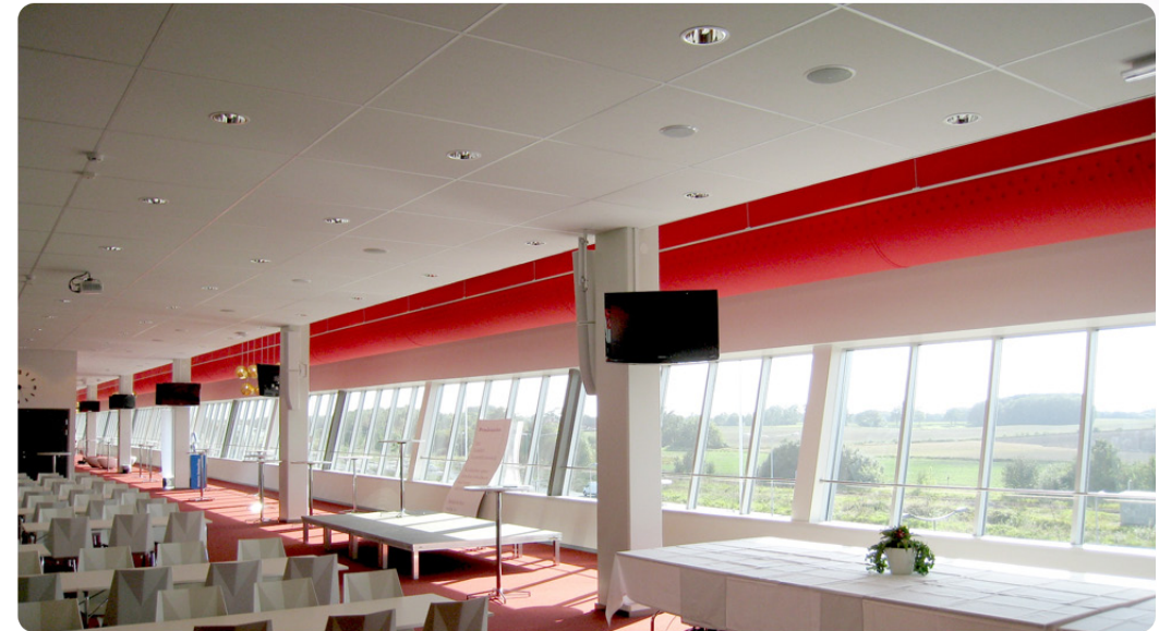
85 meter Ø 1000 mm kanal

I den side af tekstilkanalerne, som vender ud mod vinduerne, er der laser-skårne huller, hvor luften blæses ud mod vinduerne for at forhindre trækgener herfra.