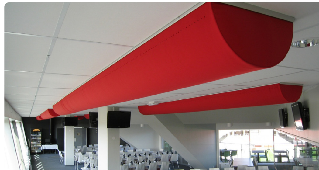
Halvrunde (D-formede) tekstilkanaler

“Da der kun var begrænset plads under loftet, var valget af tekstilkanaler den eneste løsning. Luften fordeles ensartet gennem hele systemet”.