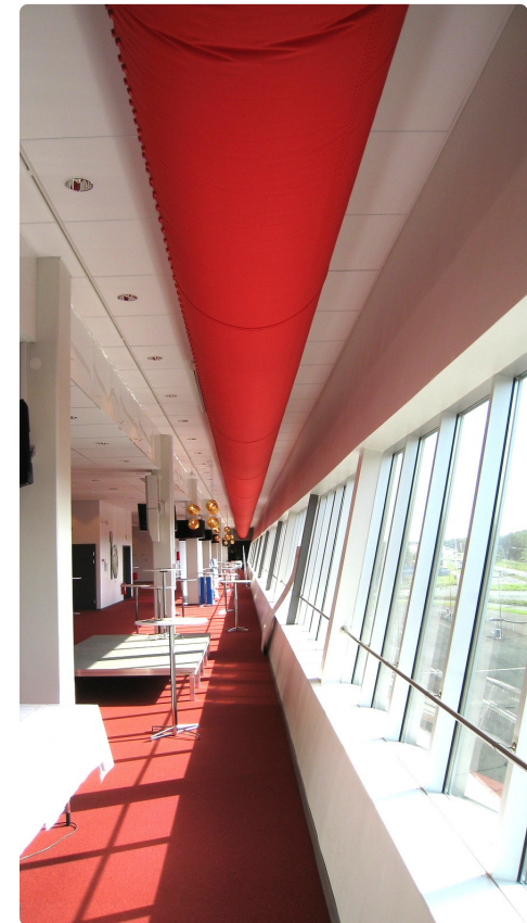
Tekstilkanaler med dyser og laserskårne huller

Stadionet, som stod færdigt i foråret 2011, har fået installeret et ventilationssystem med tekstilkanaler af typen KE-Inject Hybrid.