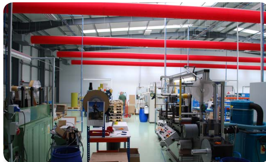
KE DireJet tekstilkanaler med Ø18 mm dyser